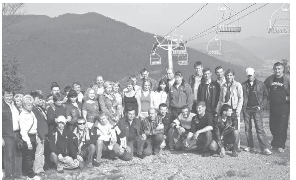
Відпочинок в Карпатах у вихідні — найбажаніший та найцікавіший для працівників Локомотивного депо різних поколінь