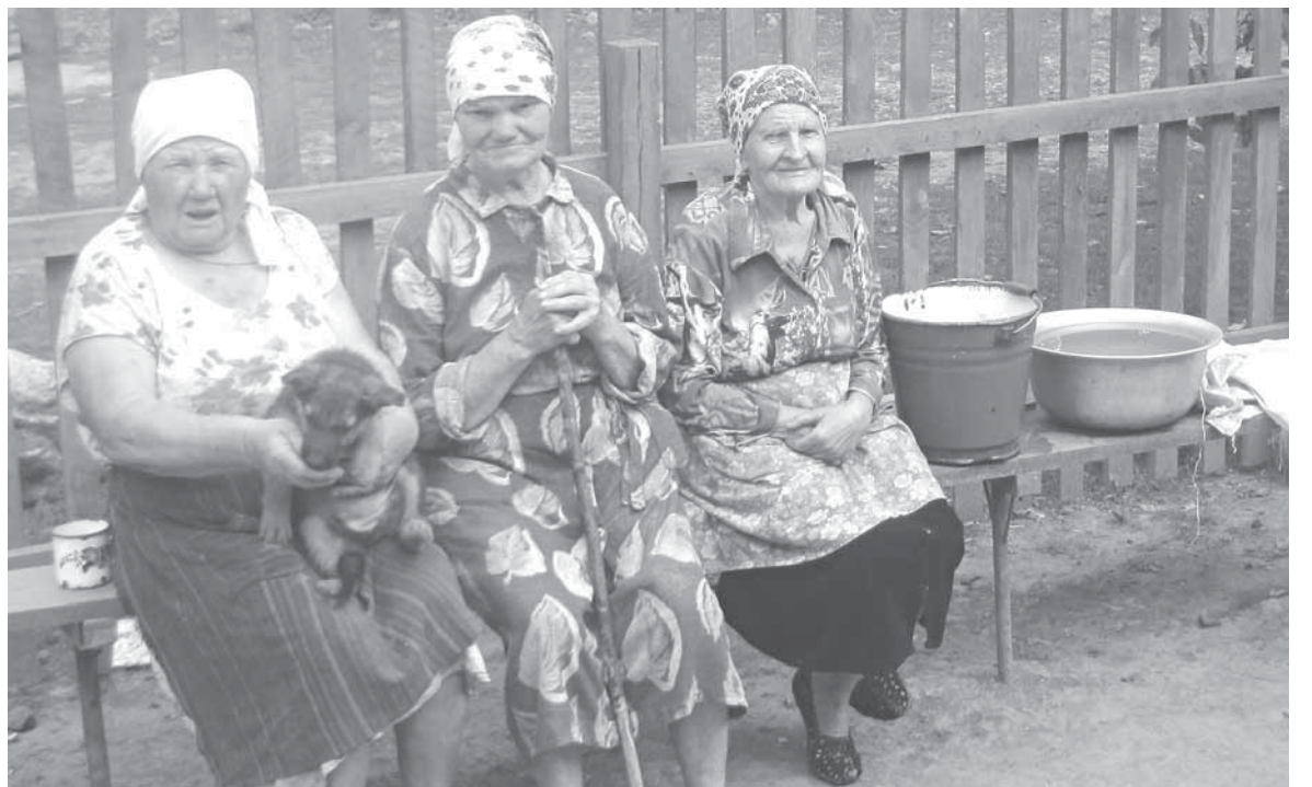
Незважаючи на нестачу води, люди залишаються оптимістами і не втрачають надії