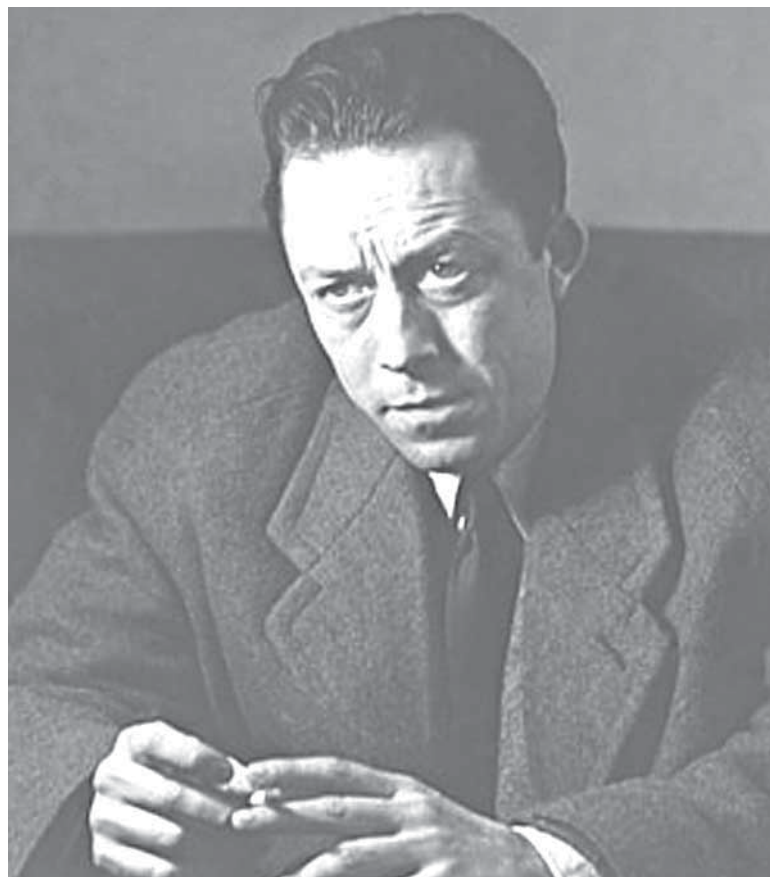
Французський письменник Альбер Камю