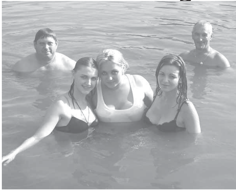
Не зважаючи на дезінформацію в водоймі на Талимонівці продовжують купатись

Стосовно іншої статті «В свої шістнадцять років будинок виглядає, як після бомбардування», то чому ви, не дуже шановні автори, дозволяєте собі обзивати нероботу таку поважну у віці та посаді людину. І ми думаємо, що мер міста не повинен залишити це поза увагою, а обов'язково зустрітись з вами в суді. Тим більше, крім безпідставного