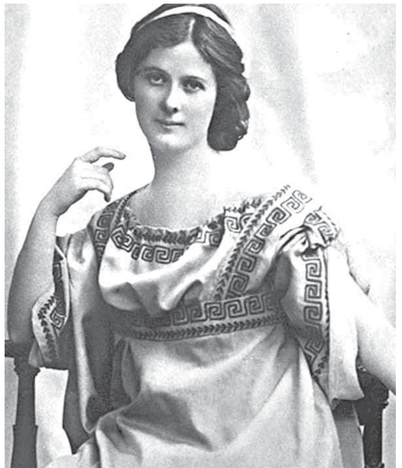
Епатажна танцівниця початку ХХ сторіччя Айседора Дункан

чому зовсім справний лімузин президента перед пострілом завмер і відмовився заводитись. Фактично в цей момент президент став ідеальною мішенню. А після пострілу автомо-