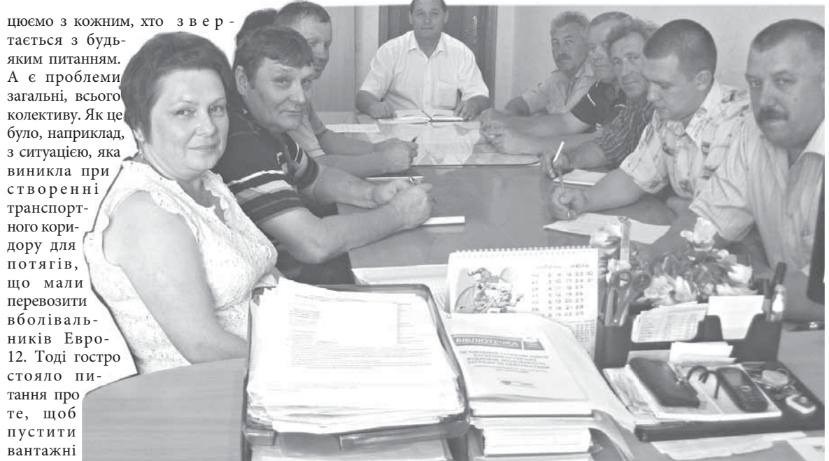
Засідання профкому зазвичай проходять в дружній та діловій атмосфері

Їїі аі аі³ і є і дї аі аæ0і і дї сї і а0 і дї Еі еі і і о еаі а äаі і н0аі 0³; Еі сү0еі . І а0а³ â 0аі 0ð³ 0âаè — æè00у ù äæ0çâаі ; і дї 0нї³ èèè. І дї аі нүаі аі і у нâі ° і дâаі³ çа0³; дї сї і а³âа° ù аі еі аа Äаñèü ²âаі і аè÷. Асрâаі еі . Дї сї і а³н0è еі і 0 ° і дї ùі , äæâ дї аі 0à і дї 0нї³ èèè аі аі èі і³ 0â00 000 і і н0ââèаі à і à «â³аі³ і і і».